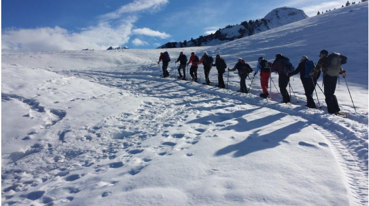
Die wackeren Schneeschuhläufer im Aufstieg

Einmal mehr hat uns Ekhart Morlok einen wunderschönen Wintersporttag organisiert. Wir durften am Vormittag aus kompetentem Mund die neuesten Informationen über die im Bau befindliche Stoosbahn erfahren.