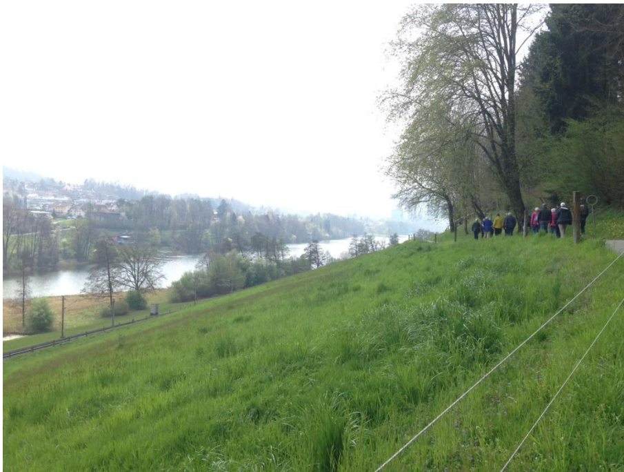
Unsere Frühjahrswanderer unterwegs am Rootsee

Diesmal hat's geklappt und der Wettergott war uns gut gesinnt. 17 TeilnehmerInnen umwanderten den Rootsee und erfreuten sich an der schönen Natur und natürlich auch an einem verdienten Zwischenhalt im Rootsee-Beizli.